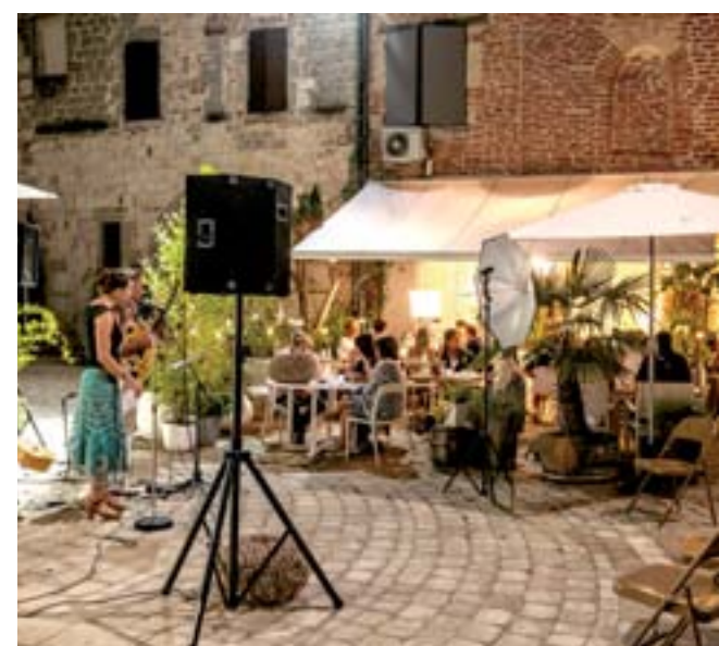
7 août 2015 : Concert par Gil et les Gadji au Restaurant Maison sur la Place