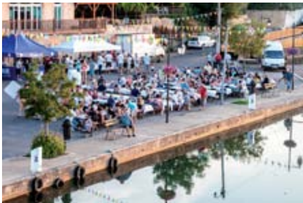
18 juillet 2015 : Fête de Port de Penne