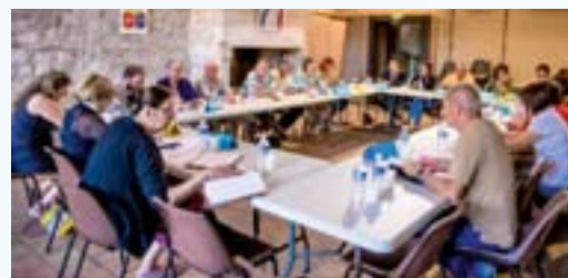
9 novembre 2015 : Réunion de préparation du Forum Santé et Bien-Être d'avril 2016

En plus de ces commissions, des réunions de travail ont lieu. Le but est de réunir les élus et les techniciens afin d'émettre des avis et de formuler des propositions sur les sujets évoqués.