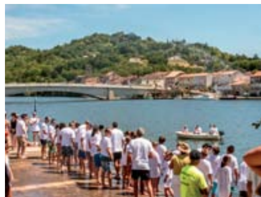
11 juillet 2015 : Big Jump