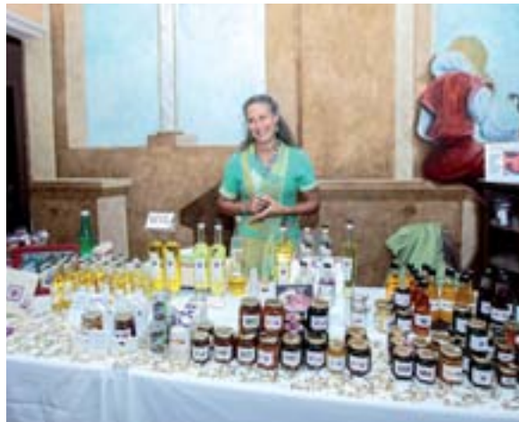
Atelier miel et safran