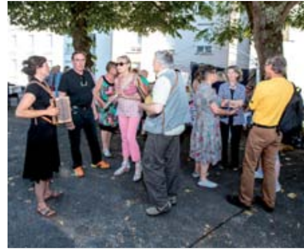
21 juin 2015 : Fête de la Musique à Penne Bourg