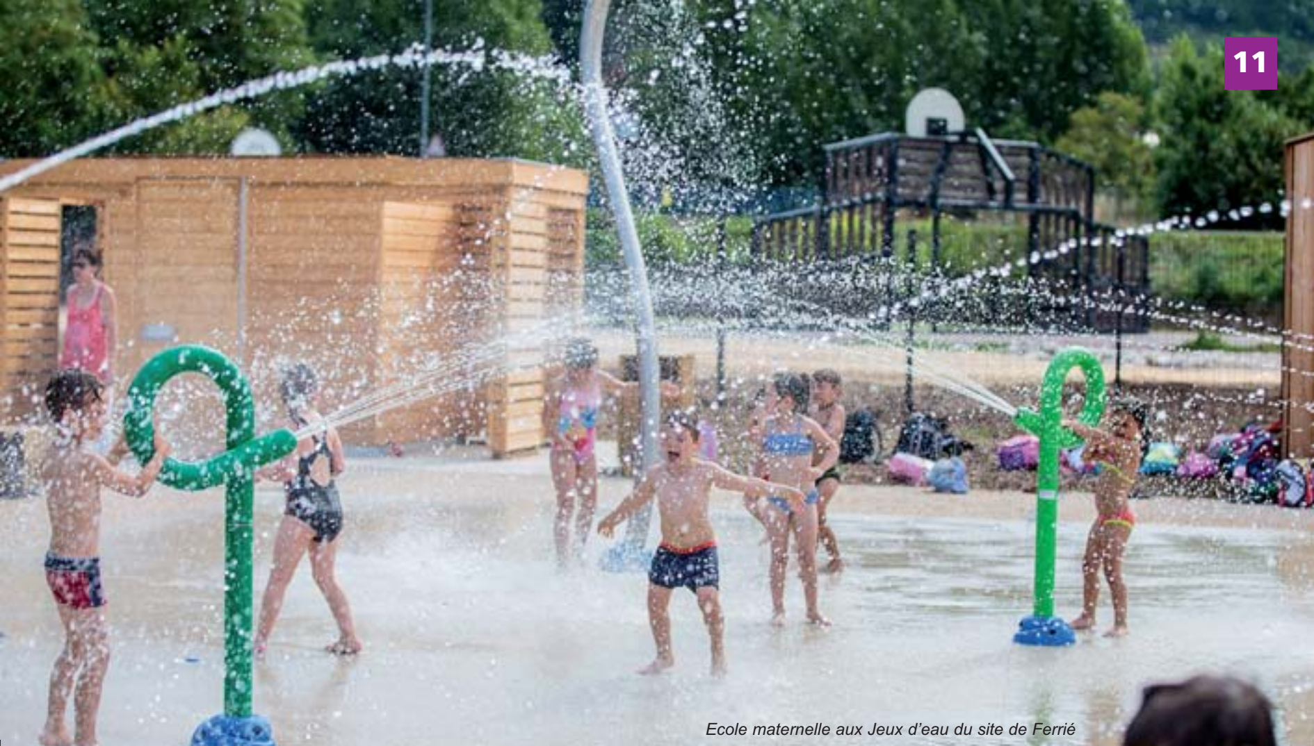
Ecole maternelle aux Jeux d'eau du site de Ferrié