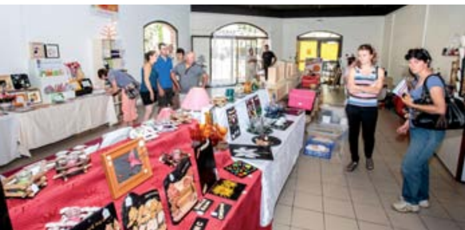
Été 2015 : « Bulle des Créateurs » expose Espace Gambetta