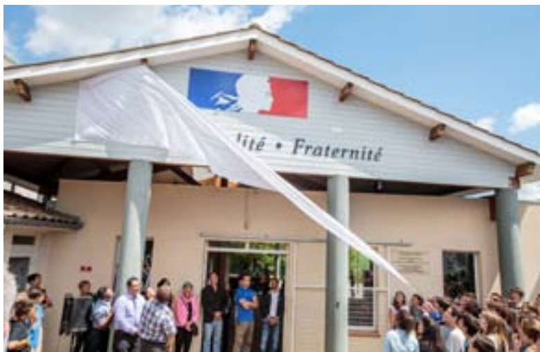
Le Fronton offert par la Municipalité

Tous les collégiens se sont investis pleinement dans cette manifestation et y ont trouvé une valeur commune : la République ! Le collège a reçu un prix collectif : un fronton portant la devise républicaine « Liberté Égalité Fraternité »