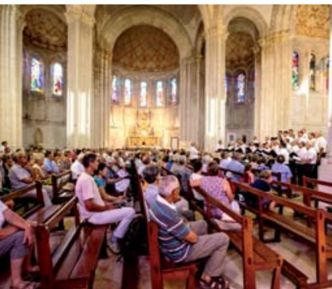
26 juillet 2015 : Choeur d'Hommes du Pays d'Albret au Sanctuaire Notre Dame de Peyragude