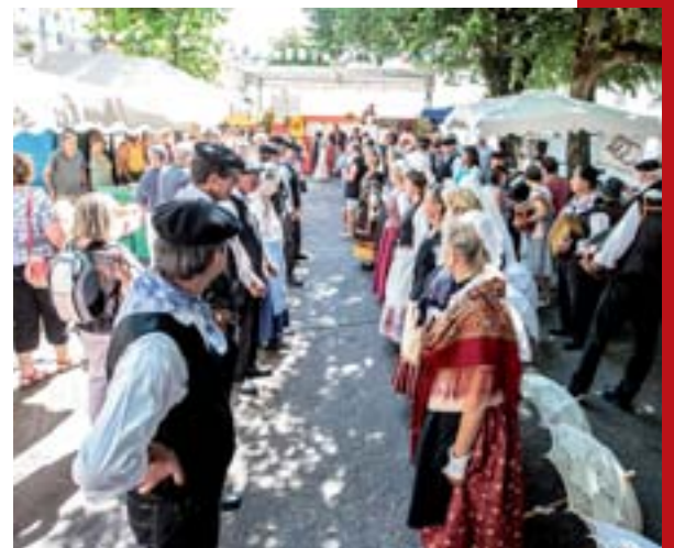
12 juillet 2015 : Foire de la Tourtière