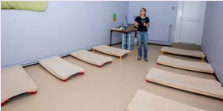
Août 2015 : Inspection des écoles (maternelle et primaire) avant la rentrée par Angélique HERNANDEZ élue Déléguée aux écoles