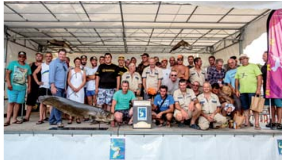
5 juillet 2015 : Concours de pêche au « silure »