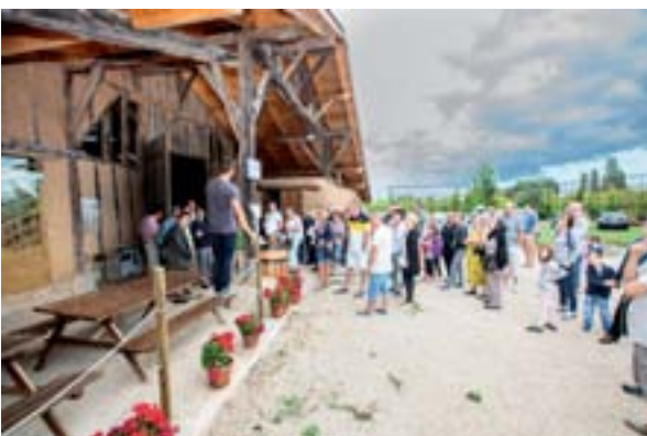
13 août 2015 : Fête de la Prune à la Ferme du Lacay