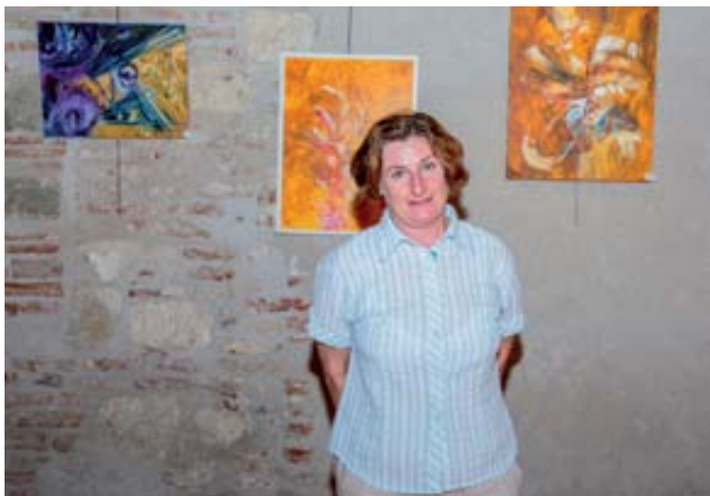
3 juillet 2015 : Vernissage G. GERVAIS DUCOURET