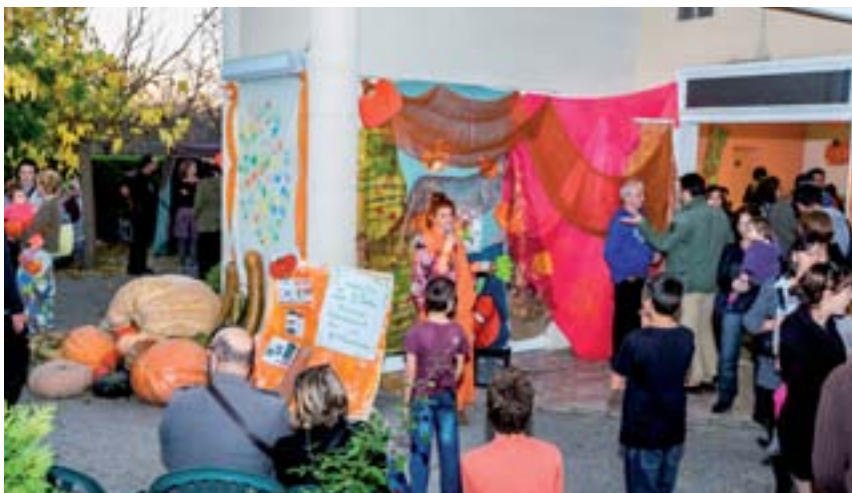
8 novembre 2015 : Citrouilles en Fête par « Les 3 Portes »