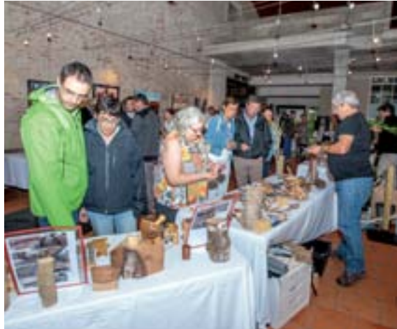
Stand de coutellerie