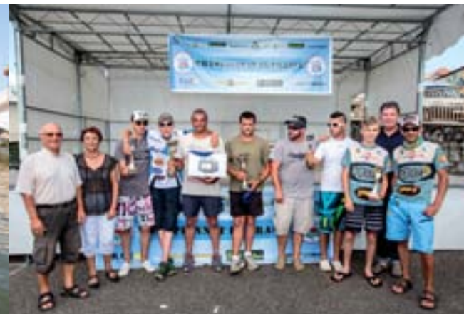
19 juillet 2015 : Pêche aux Carnassiers