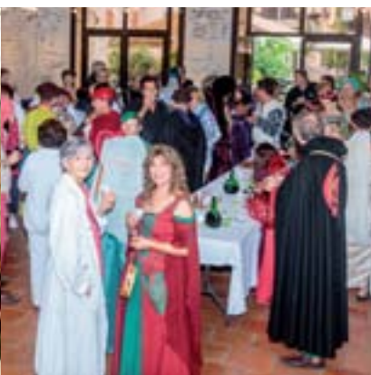
23 août 2015 : Un jour au Moyen Age : passe rue costumé dans le bourg médiéval et banquet médiéval au Château de Noailiac par les Amis du Patrimoine