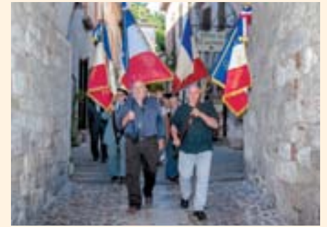
19 août 2015 : Commémoration