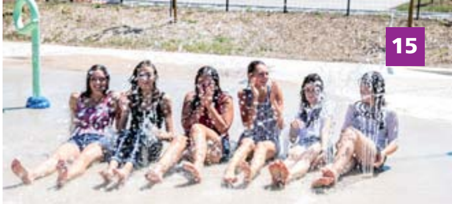
Juillet 2015 : les collégiens sur le site de Ferrié