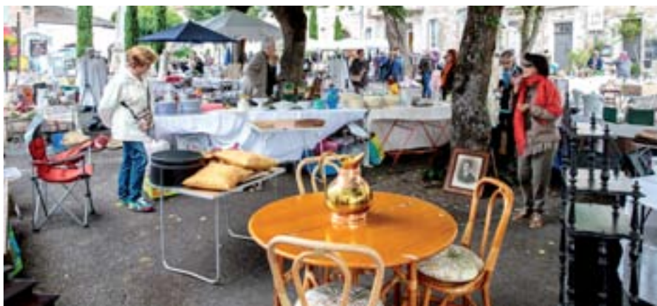
25 mai 2015 : Vide Grenier « Les 3 Portes »