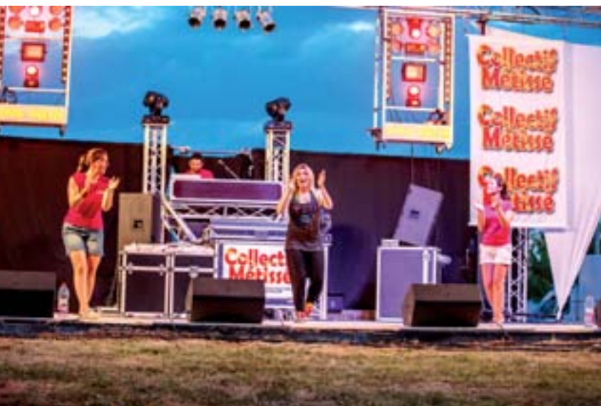
4 juillet 2015 : Collectif Métissé à Croquelardit