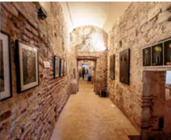
31 juillet 2015 : Vernissage de Penne 'Art Paperolles pour célébrer leurs 10 ans