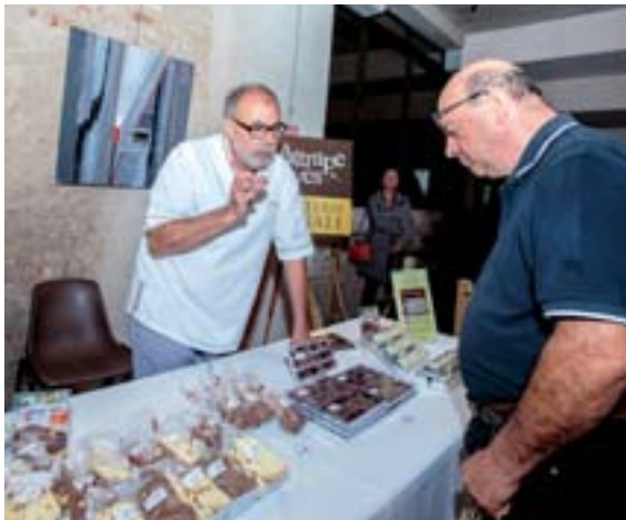
Dégustation de chocolat