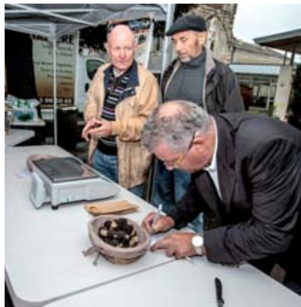
Marché au Truffes d'été