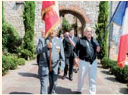
14 juillet 2015 : Commémoration