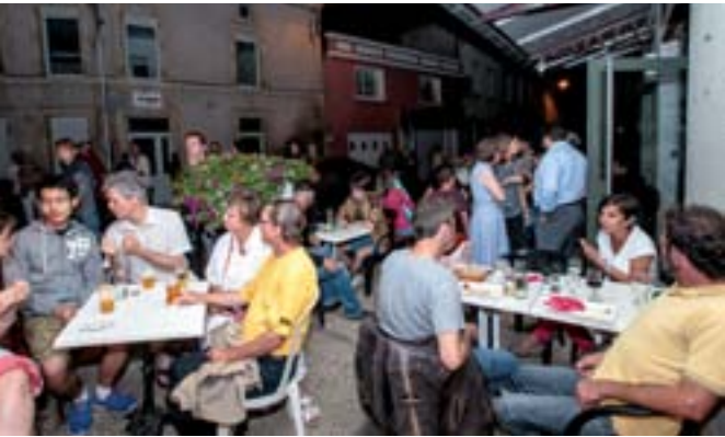
20 juin 2015 : Fête de la Musique à Port de Penne