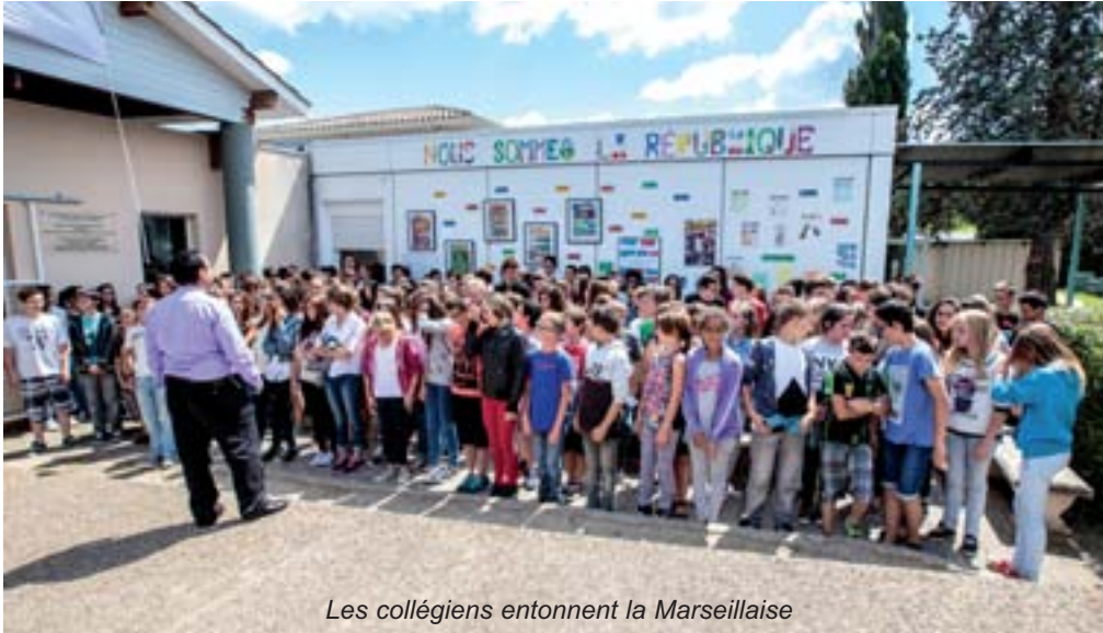
Les collégiens entonnent la Marseillaise

Mettre des mots sur les valeurs républicaines, voilà ce que la Commune a permis aux collégiens le 16 juin 2015.