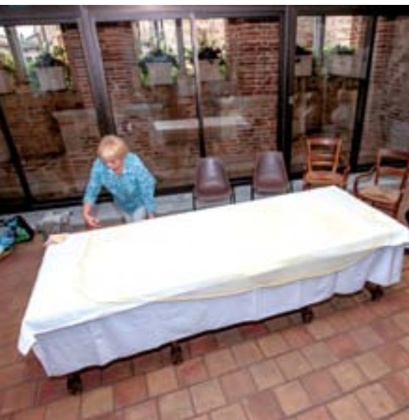
Démonstration de confection de tourtière