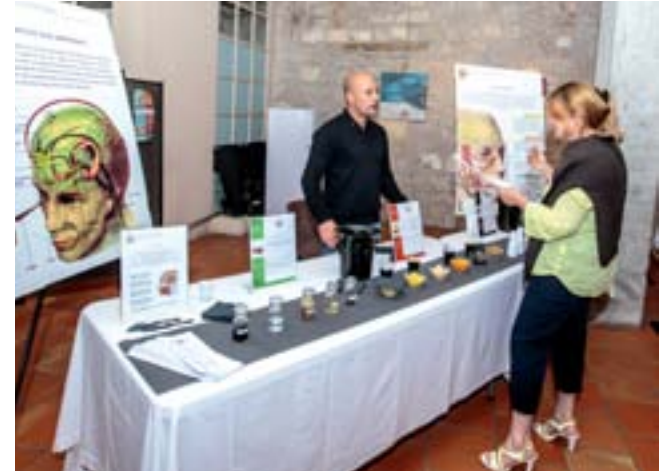
Atelier Arômes et Saveurs