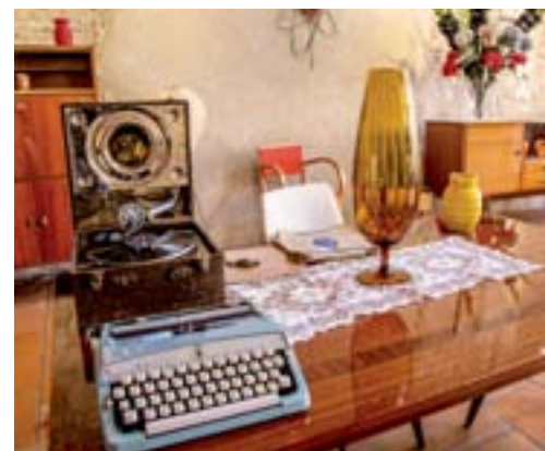
Octobre-Novembre 2015 : Expo «Vintage» dans le hall de la Mairie