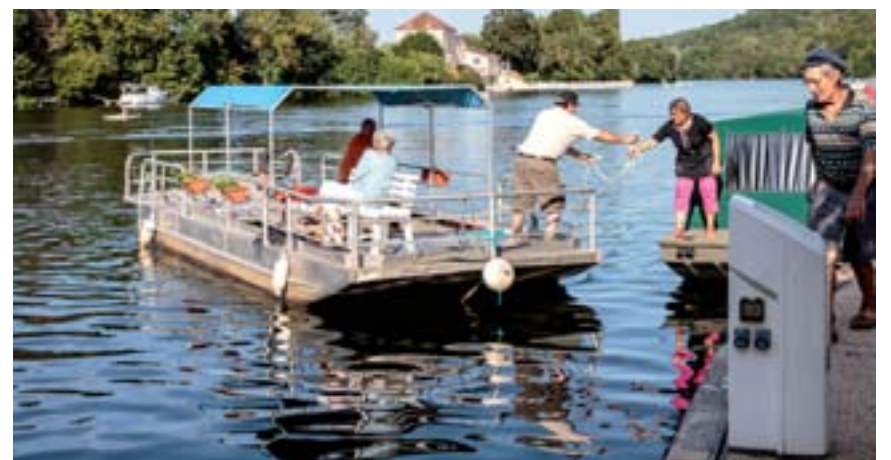
De juin à septembre : le port tourne à plein régime... bateaux, paddles, pédalos...