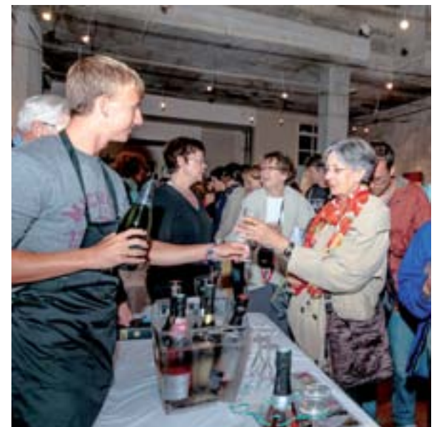
Dégustation de champagne servi par un jeune Seneffois