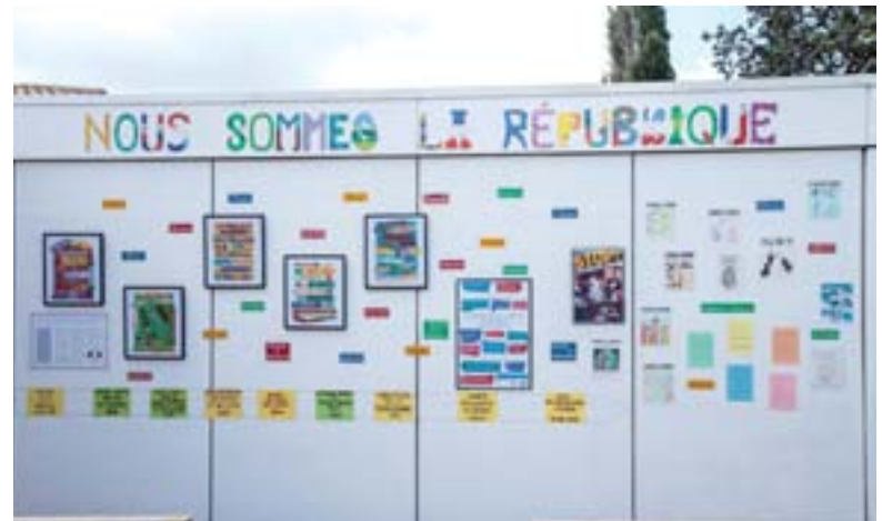
Le mur de la République