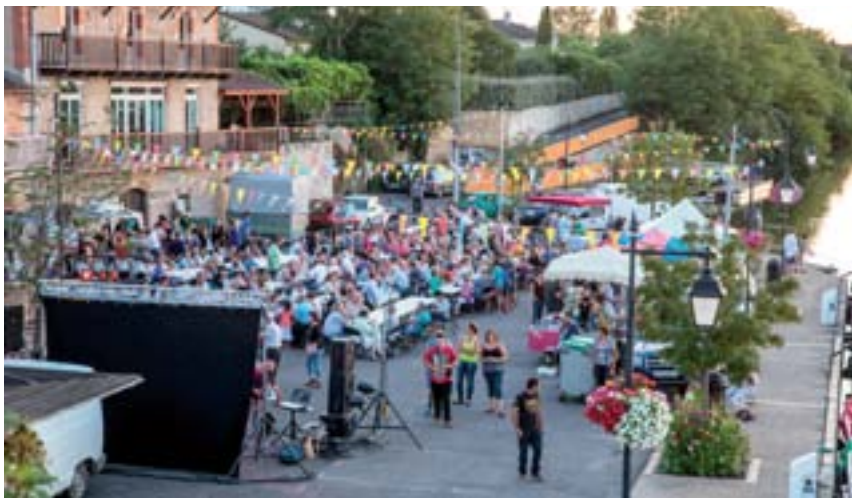
30 juillet 2015 : Marché Gourmand à Port de Penne