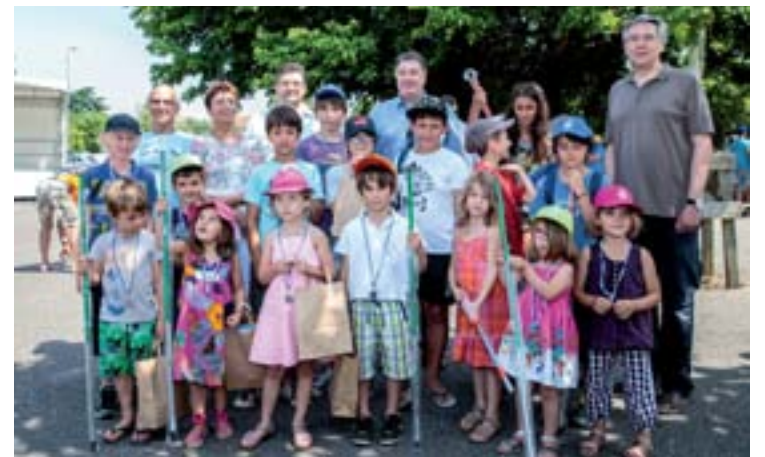
5 juillet 2015 : Prix jeunes pêcheurs