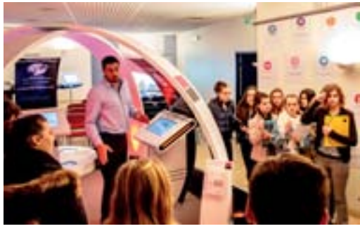
3 avril 2015 : visite des collégiens à la CCI d'Agen

d'un film « We love entrepreneurs ». L'objectif de cette semaine est de sensibiliser les jeunes aux futurs métiers de l'industrie, de la micro-entreprise, du développement durable et de l'environnement, et également d'élargir leur champ de vision vers des filières universitaires.