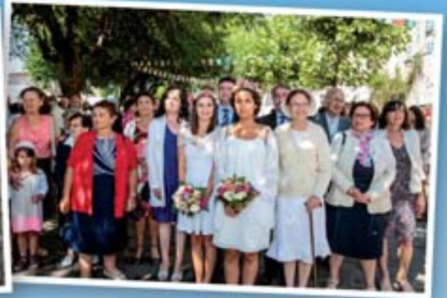
Les élus au service