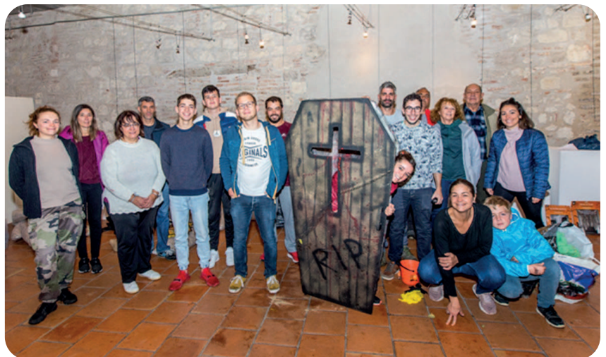
L'équipe d'Anima Penne : Merci à eux pour cette soirée inoubliable !