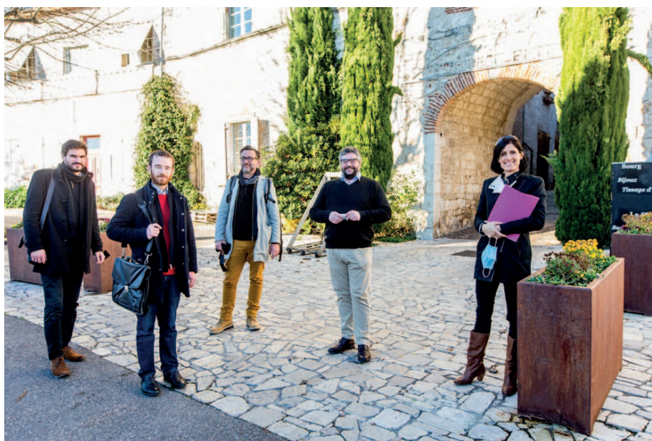
Réunion avec la région, la DRAC et le département pour le projet de Quartier Culturel Créatif

Le débat d’orientation budgétaire proposé au Conseil Municipal du 14 Décembre a fait apparaître de nombreux investissements sur la Commune en 2021. ”