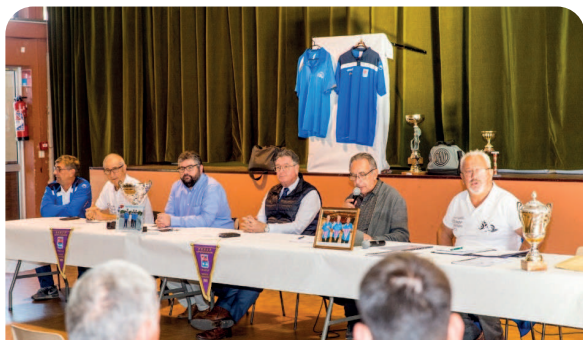
Assemblée Générale Pétanque Octobre 2021