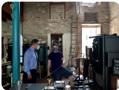
Verre Zé Bulles