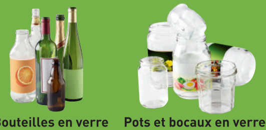
Bouteilles en verre Pots et bocaux en verre