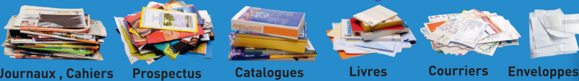
Journaux , Cahiers Prospectus Catalogues Livres Courriers Enveloppes