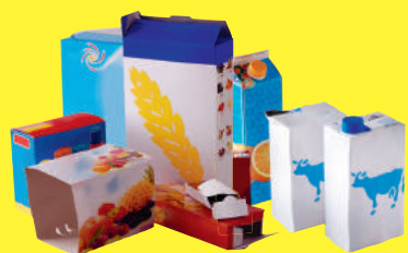
Emballages et briques en carton