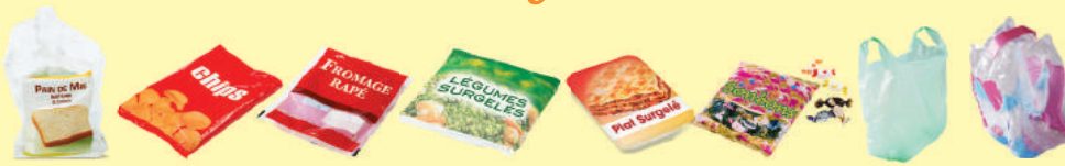
Tous les sacs, sachets et films en plastique