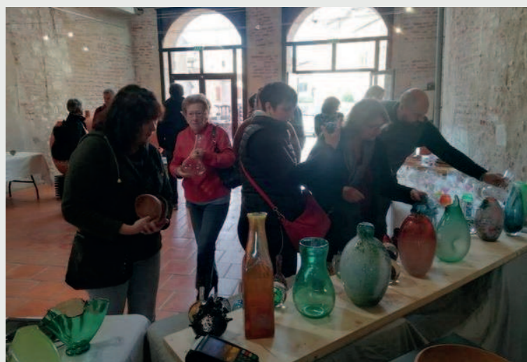
Un public venu en nombre.

fins de série de nos artisans étaient ainsi mis à la disposition du public. A la mi-journée, la majorité des pièces avaient ainsi trouvé leur nouveau propriétaire, preuve de la belle réussite de cet événement !